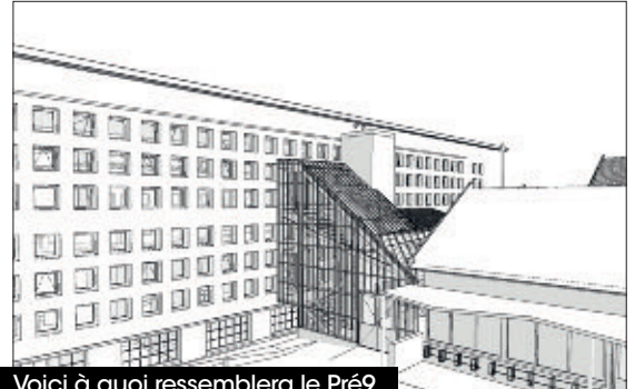
Voici à quoi ressemblera le Pré9.

Les travaux ont commencé par le plateau dédié aux expositions de 2angles notamment. Il se poursuivra par les bureaux à l'étage du dessous et le sous-sol. Dans l'autre bâtiment, un restaurant d'insertion sera aménagé ainsi qu'une grande salle avec gradins modulables, des salles de répétition/enregistrement, un atelier pour la Régie des Quartiers et des sanitaires. Les deux sites seront reliés par une verrière dotée d'un ascenseur et d'un récupérateur d'eaux de pluie. Les travaux devraient s'étaler sur 2025. Le projet est cofinancé notamment par l'Union européenne, au titre du Fonds européen de développement régional