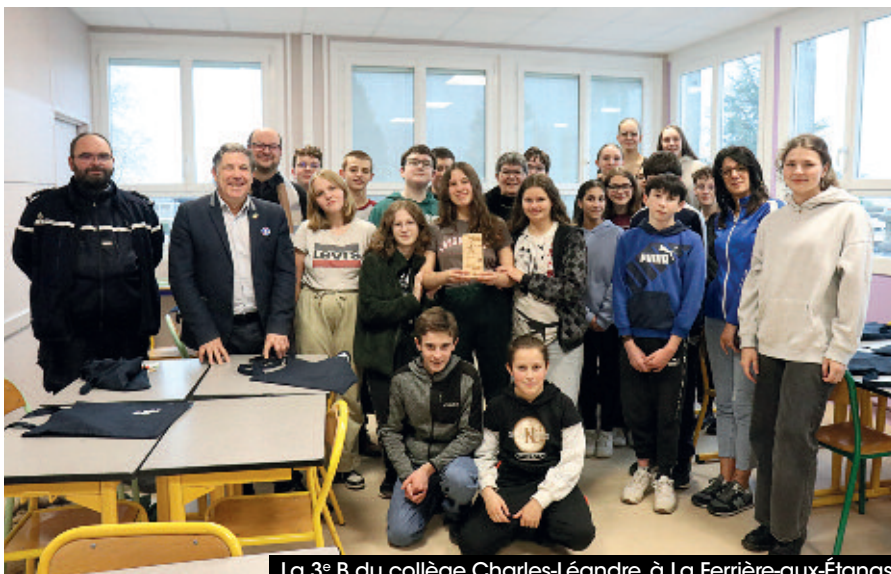
La 3 e B du collège Charles-Léandre, à La Ferrière-aux-Étangs.

En parallèle, un challenge était organisé lors duquel les élèves devaient répondre à un questionnaire en rapport avec chaque atelier. La 3 e B du collège Charles-Léandre,