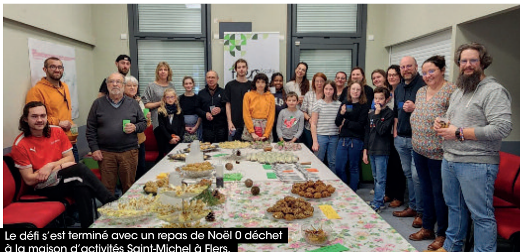
Le défi s'est terminé avec un repas de Noël 0 déchet à la maison d'activités Saint-Michel à Flers.

> Pour participer au prochain défi, il faut contacter Emma Etienne: eetienne@flers-agglo.fr .