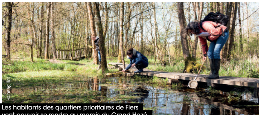
Les habitants des quartiers prioritaires de Flers vont pouvoir se rendre au marais du Grand Hazé.

Service santé au 02 33 98 22 02. Inscriptions auprès des maisons d'activités Saint-Michel (02 33 62 33 10) et Émile-Halbout (02 33 64 25 73) à Flers.