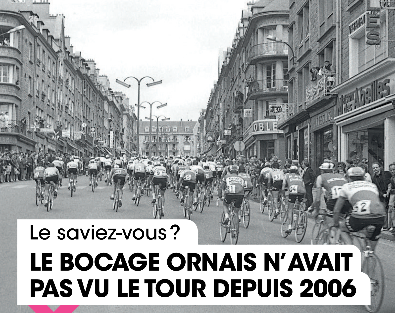
Passage du Tour de France, à Flers, en 1964.