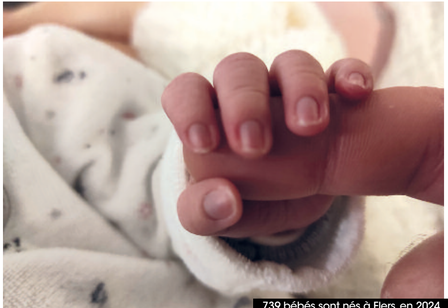
739 bébés sont nés à Flers, en 2024.

En ce qui concerne les autres chiffres de l'état civil, 60 mariages ont été célébrés à