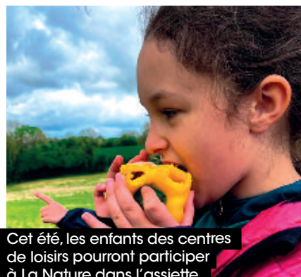
Cet été, les enfants des centres de loisirs pourront participer à La Nature dans l'assiette.

Le Plan alimentaire territorial de Flers Agglo a été lancé en 2021. Il vient d'être labellisé par l'État pour 5 ans et financé pour 3 ans.