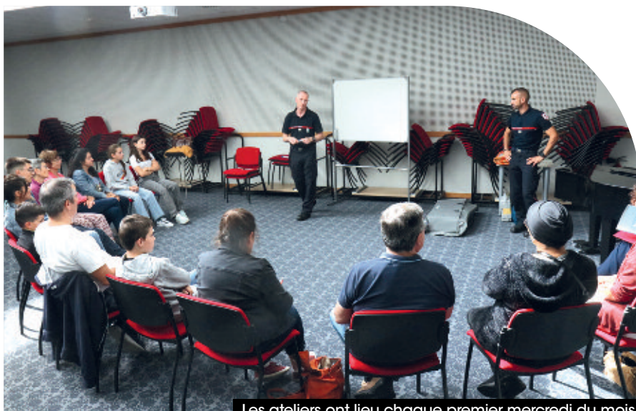
Les ateliers ont lieu chaque premier mercredi du mois.

Ces ateliers gratuits et accessibles à tous, dès 10 ans, sont programmés chaque premier mercredi du mois de 14h à 16h dans différents lieux sur le territoire de Flers Agglo (médiathèque de La Ferté-Macé, espace culturel du Houleme à Briouze, salle paroissiale d'Athis-de-l'Orne).