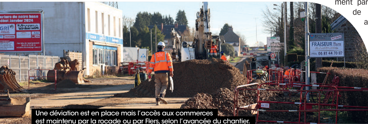
Une déviation est en place mais l'accès aux commerces est maintenu par la rocade ou par Flers, selon l'avancée du chantier.

Les travaux d'aménagement à proprement parler pour rendre l'entrée de ville plus accueillante, accessible et sécurisée commenceront en septembre 2025 et devraient durer entre 12 et 18 mois. La rue de la Gérodière à Flers, entre le rond-point du Pont-Féron et le lycée Jean-Guéhenno, devrait être refaite au premier trimestre 2025.