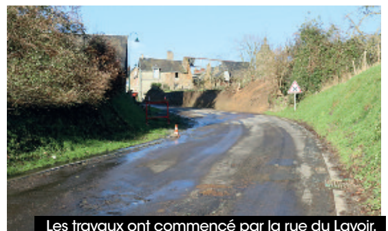
Les travaux ont commencé par la rue du Lavoir.

39000 €. La commune peut également compter sur une subvention de l'État au titre de la Dotation d'équipement des territoires ruraux. La reprise du réseau d'eaux pluviales (moins de 50000 € hors taxes) et la mise en accessibilité de l'arrêt de car (environ 6500 € hors taxes) sont à la charge de Flers Agglo.