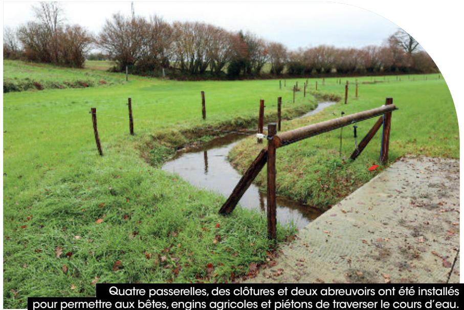
Quatre passerelles, des clôtures et deux abreuvoirs ont été installés pour permettre aux bêtes, engins agricoles et piétons de traverser le cours d'eau.

En amont, le niveau d'eau des étangs des Petites Noës a été baissé pour éviter qu'ils ne débordent et la vanne a été refaite en 2019. Ces aménagements