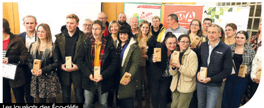
Les lauréats des Éco-défis.

En 3 ans, plus de 90 entreprises ont été labellisées. Ce dispositif sera renouvelé en 2025.