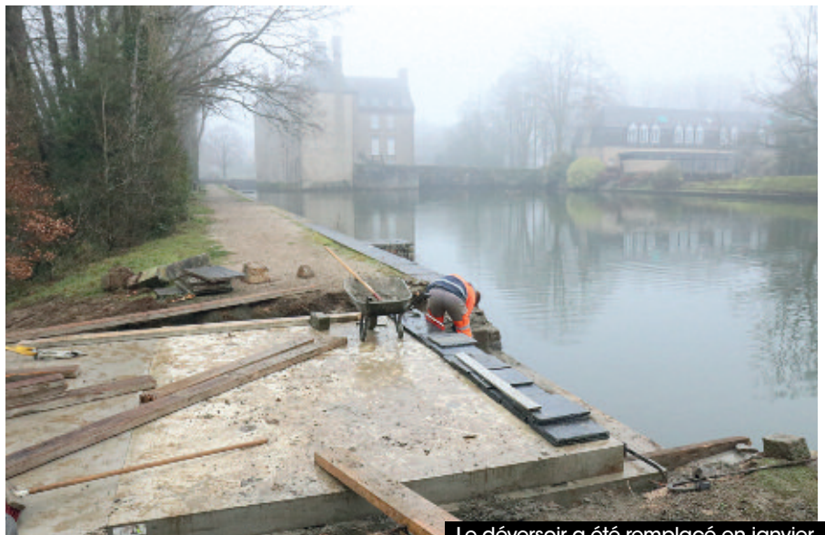
Le déversoir a été remplacé en janvier.

supprimée. Derrière les Bains Douches Numériques, rue Simons, une rivière va être créée pour favoriser le transit des sédiments et la migration des poissons.