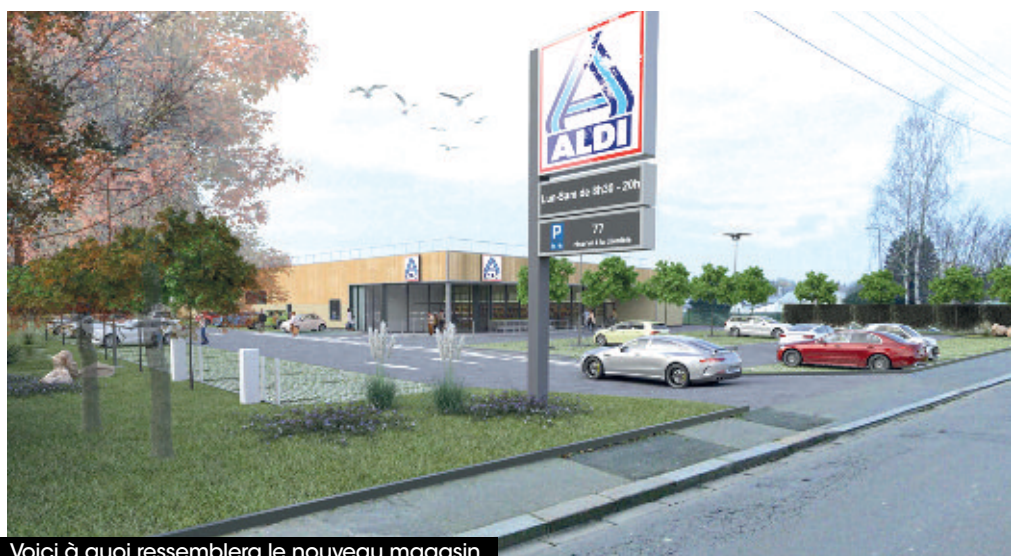
Voici à quoi ressemblera le nouveau magasin.

Trois nouveaux recrutements sont prévus au sein de l'équipe de magasin qui à terme comptera 12 personnes.