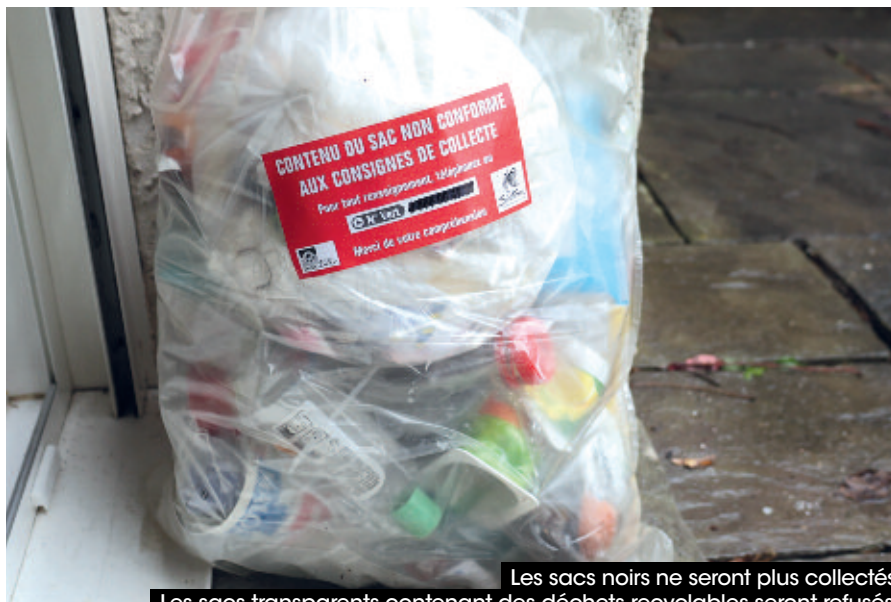
Les sacs noirs ne seront plus collectés. Les sacs transparents contenant des déchets recyclables seront refusés.

Ces sacs transparents, mis à disposition aux mêmes points de distribution que les sacs jaunes par le Sirtom, seront fournis gratuitement aux usagers qui devront les récupérer eux-mêmes. Chaque foyer recevra, pour la première dotation, un rouleau de sacs transparents et deux rouleaux de sacs jaunes. Il sera possible de récupérer d'autres rouleaux lorsque cette première dotation sera consommée.