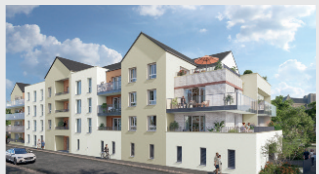
La résidence comptera 37 logements de 38 à 87 m 2 .

D'infos : Agence Foncia de Flers 14, rue de La Boule Contact au 02 33 65 58 44 ou ft-normandieflers@foncia.fr