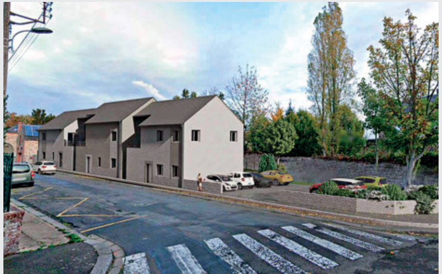
Voici à quoi ressemblera le bâtiment de six logements.

Le bâtiment sur deux niveaux abritera deux logements de type 2 avec une chambre et quatre logements de type 3 avec deux chambres. Une coursive sera aménagée permettant