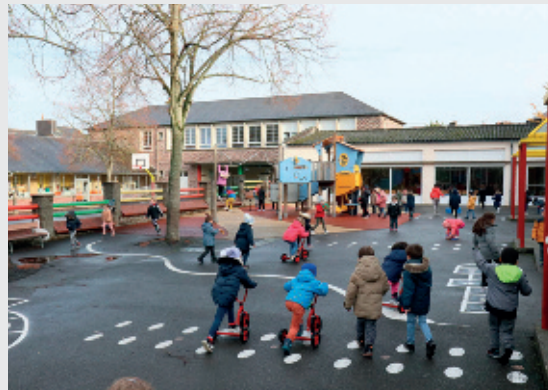
Les enfants sont accueillis de 7 h 30 à 18 h 15 dans les écoles publiques de Flers

Après la classe et le goûter offert par la Ville de Flers, les enfants qui restent à l'accueil du