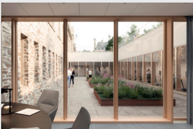
Le patio côté cour d'honneur.

Les travaux doivent démarrer au printemps 2025. La phase d'étude, actuellement en cours, doit s'achever fin 2024.