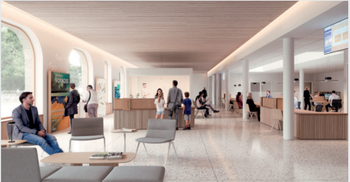
Le hall d'accueil.

La reconstruction de la mairie sera l'occasion de revoir les espaces pour un meilleur accueil du public et d'en faire un site exemplaire en matière de consommation d'énergie.