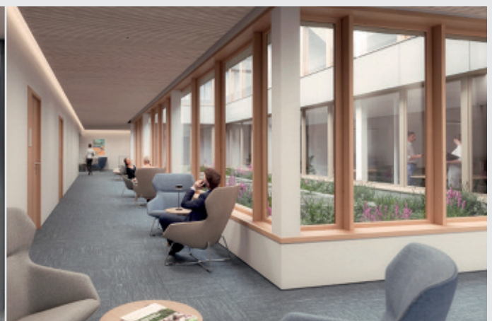
Le puits de lumière de l'extension côté étangs.