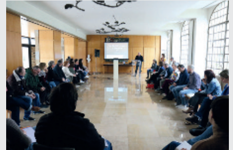
Le premier Rendez-vous de la solidarité a été organisé le 19 février par le CCAS de la Ville de Flers.

Une expérimentation a été menée dans un quartier de Flers. Des permanences ont été mises en place pour informer les habitants et les accompagner le cas échéant. En parallèle, une convention a été signée entre la Caisse d'allocations familiales (CAF) et la Caisse primaire d'assurance maladie (CPAM) pour échanger des données. 29 familles monoparentales éligibles à la Complémentaire Santé