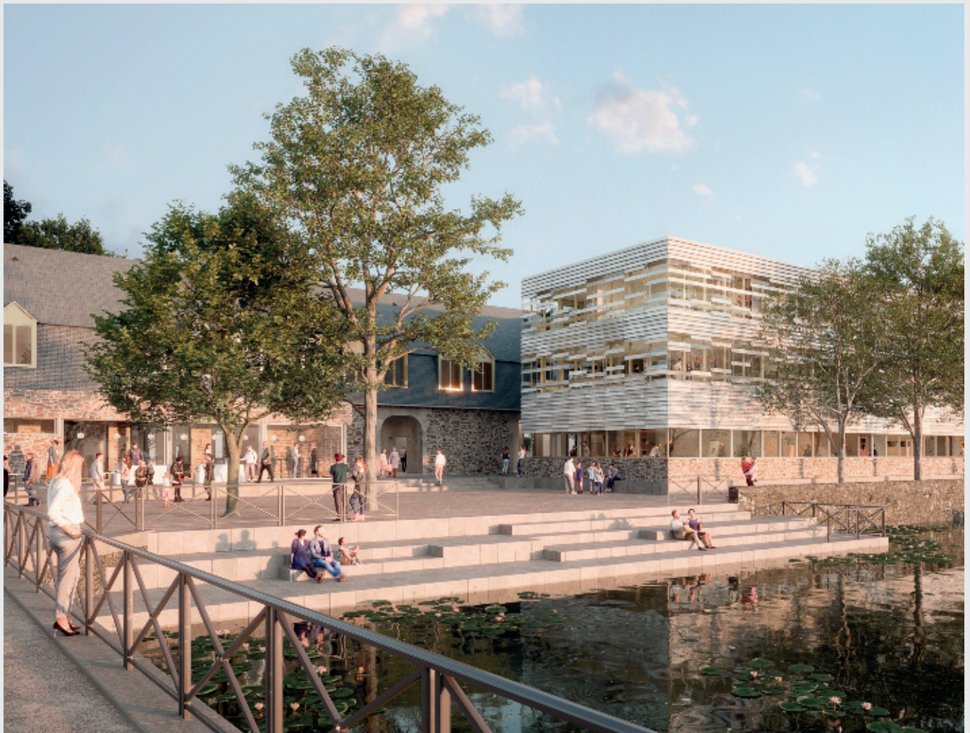
Les passages vers le grand étang et l'entrée de la mairie seront conservés à leurs positions actuelles.

Pour rappel, la mairie avait été endommagée à 87 % suite à l'incendie du 9 novembre 2019. Une enquête judiciaire avait été ensuite menée durant laquelle le site a dû rester en l'état. Elle a été classée sans suite en mai 2022. Le concours d'architectes a été lancé en mars 2023 à l'échelle nationale. Trois projets ont été retenus le mois d'octobre suivant parmi 48 candidatures.