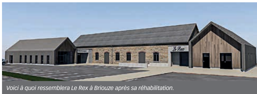
Voici à quoi ressemblera Le Rex à Briouze après sa réhabilitation.

Ce programme va permettre de soutenir plusieurs projets que les trois collectivités vont lancer prochainement.