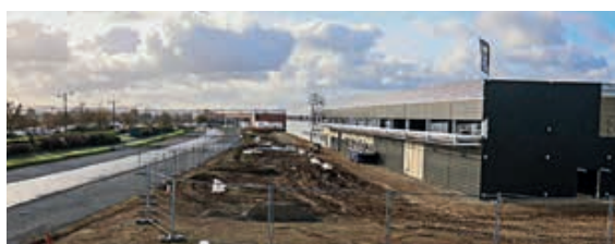
Les travaux de la nouvelle usine Thermocoax devraient être finis en septembre 2021.

Normand'Innov, à Caligny, est un parc d'activités tourné vers l'innovation et l'excellence. Le site est occupé par Faurecia, qui dispose d'un centre de production et d'un centre mondial de recherche et développement, et le Groupe Lemoine, leader européen des produits de soin et d'hygiène à base de coton. Les deux entreprises seront bientôt rejointes par Thermocoax, spécialisée dans les applications chauffantes et les capteurs, dont la nouvelle usine de 12800 m 2 est en cours de construction. Normand'Innov compte aussi un centre d'essais dynamiques. Cette plateforme collaborative, dédiée à l'analyse des matériaux, est reconnue au niveau mondial.