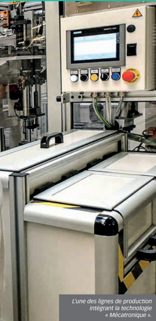
L'une des lignes de production intégrant la technologie « Mécatronique ».