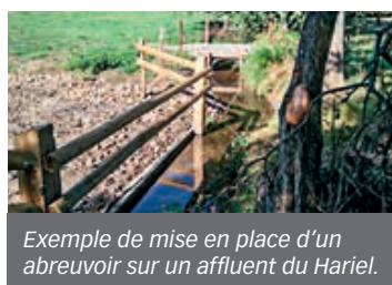
Exemple de mise en place d'un abreuvoir sur un affluent du Hariel.

Ces travaux consistent notamment à entretenir les berges et mettre en place des clôtures et abreuvoirs pour éviter la contamination de l'eau et le piétinement des berges par les animaux. Il s'agit aussi de restaurer la continuité écologique des cours d'eau et limiter le risque d'inondations. La première tranche du programme