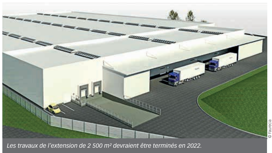
Les travaux de l'extension de 2 500 m 2 devraient être terminés en 2022.

C'est pourquoi une extension de 2 500 m 2 va être construite sur le site de Caligny. Les travaux devraient être terminés au cours du printemps 2022. L'extension du bâtiment a vocation à accueillir la zone actuelle expédition/logistique amenée à déménager. Les nouvelles lignes de production pourront intégrer l'espace de 2 500 m 2 ainsi libéré. Cela va permettre l'installation d'une troisième ligne de production « Mécatronique ». Ce gain de place, c'est aussi un gain de productivité. Les lignes seront calibrées pour sortir une pièce toutes les 6 secondes contre 18 actuellement.