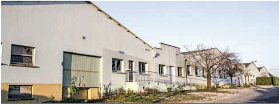
La friche appartenait à l'imprimeur Corlet. Auparavant, elle abritait l'entreprise de textile Chanu.

Les travaux de démolition de la friche Corlet, à La Ferrière-aux-Étangs, ont commencé. Le terrain de plus de 6000 m 2 accueillera des logements.