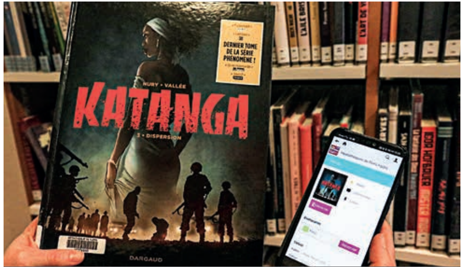
L'application Ma Bibli permet d'avoir accès à l'ensemble du catalogue des médiathèques à partir d'un portable.

Autre fonction de cette application : l'agenda