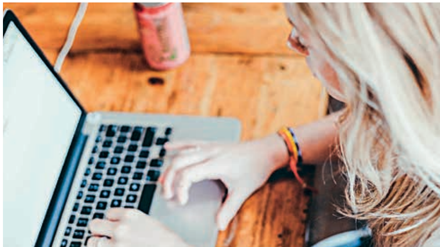
Le Campus connecté, sur le site de Normand'Innov, est un dispositif qui permet de rapprocher l'enseignement supérieur des territoires.

Les étudiants disposeront d'une salle de cours connectée et équipée au sein de l'antenne de l'Ensicaen. Pour les accompagner dans leur cursus, ils seront encadrés et accompagnés par un tuteur mis à disposition par Flers Agglo qui fournit également le matériel nécessaire à l'apprentissage. Quelle que soit la filière choisie (droit, histoire, psychologie, STAPS, biologie etc.) la formation dispensée garantit la même reconnaissance et la même qualité de diplôme que dans une université classique.