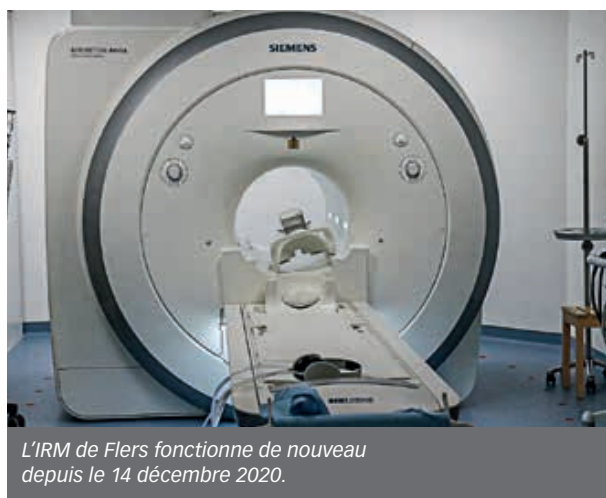
L'IRM de Flers fonctionne de nouveau depuis le 14 décembre 2020.

Le lieu a pu rouvrir au tout début du mois de novembre. Quelques jours plus tard, les examens de scanner étaient de nouveau