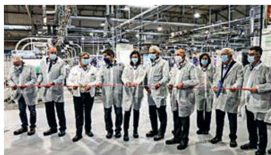
L'inauguration des premières lignes de production intégrant la technologie de la Mécatronique, mardi 5 janvier 2021.

Nous sommes un acteur important de l'économie locale et régionale, et nous voulons le rester.