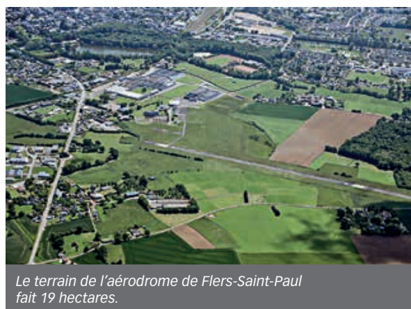
Le terrain de l'aérodrome de Flers-Saint-Paul fait 19 hectares.

L'entreprise appartient depuis 2020 au groupe