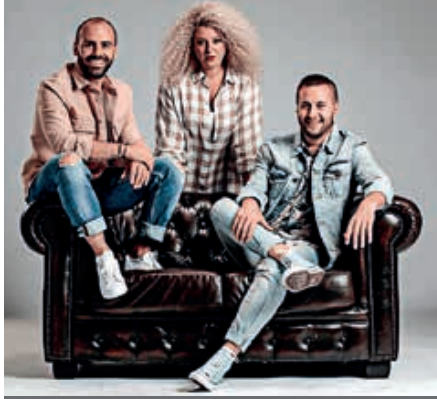
3 Cafés Gourmands ouvrira sa tournée de l'automne à Flers au Forum.

Le célèbre trio corrézien, connu pour son enthousiasme contagieux, sa joie de vivre et sa sympathie, promet de vous faire danser et chanter au son de leur nouvel album « Comme des enfants » (oct. 2020).