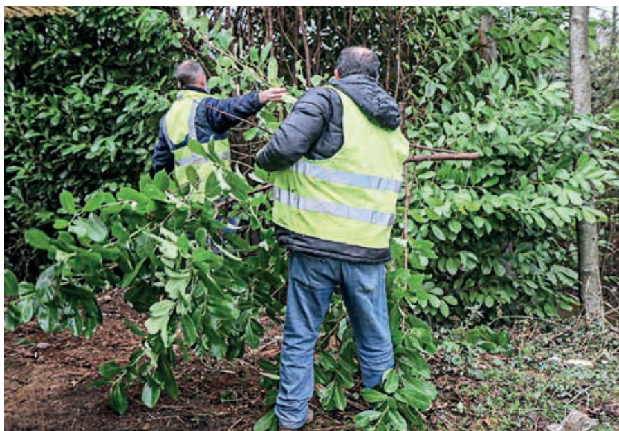
La Ville et l'Agglo mobilisent leurs services pour accueillir des personnes devant exécuter une peine de Travail d'intérêt général comme ici pour l'entretien au stade du Hazé.

Lors d'une rencontre avec le Spip, Yves Goasdoué a souligné l'intérêt de cette démarche, sachant que la collectivité pilote et anime