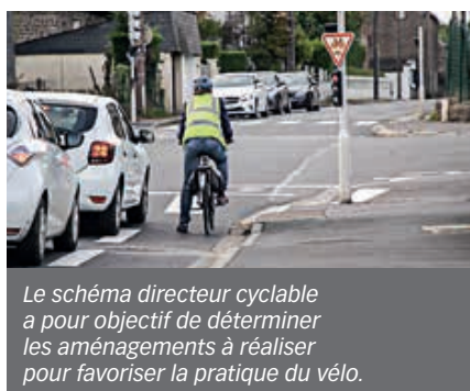
Le schéma directeur cyclable a pour objectif de déterminer les aménagements à réaliser pour favoriser la pratique du vélo.

Le jalonnement des itinéraires est également