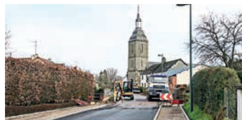
À Pointel, les travaux d'aménagement ont commencé en octobre.

Le bourg de Rouvrou, à Ménil-Hubert-sur-Orne, est en travaux depuis le début du mois de février. Le chantier, estimé à 250 000 €, bénéficie d'un fonds de concours de Flers