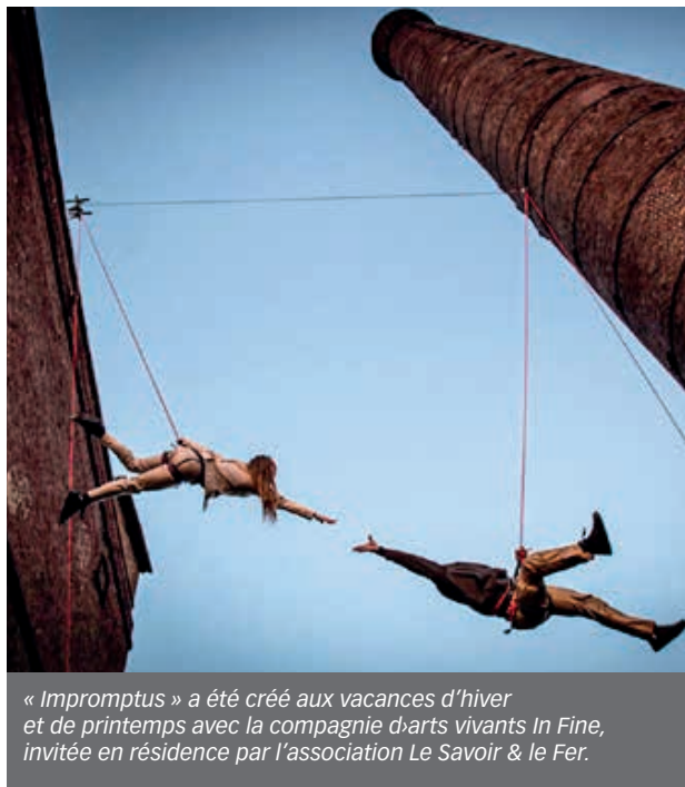
« Impromptus » a été créé aux vacances d'hiver et de printemps avec la compagnie d'arts vivants In Fine, invitée en résidence par l'association Le Savoir & le Fer.

Ces deux résidences d'artistes ont bénéficié du soutien de Flers Agglo, la DRAC et la Région Normandie.